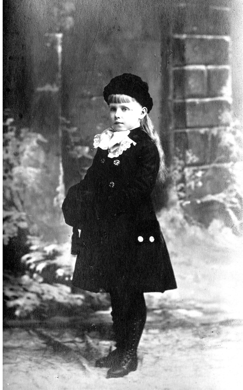
Principesa Maria la 7 ani