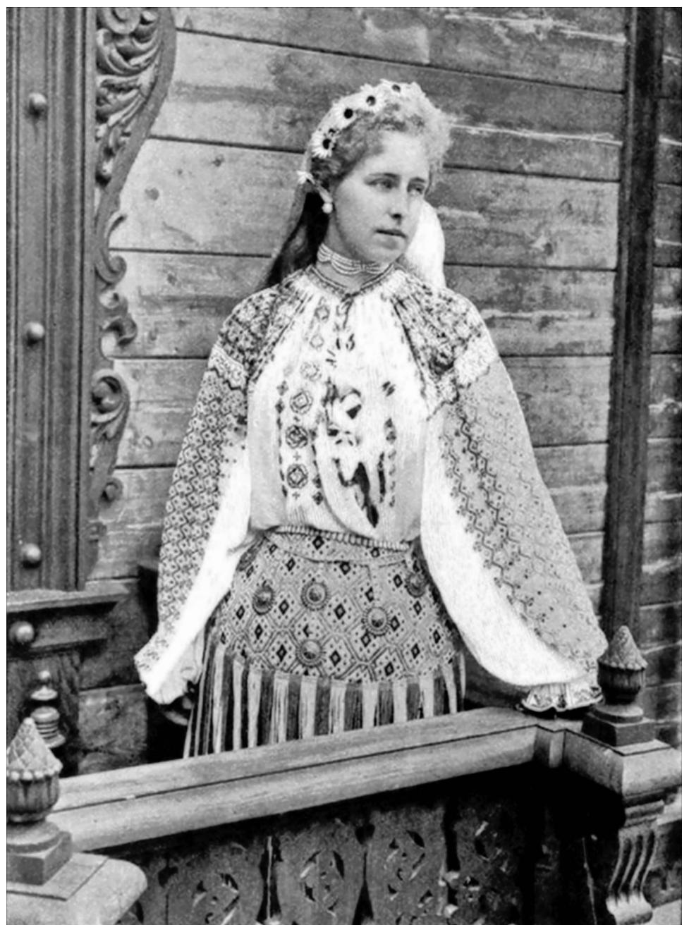
Principesa Maria, 1891