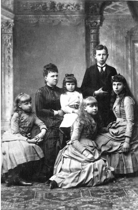
Marea Ducesă Maria Alexandrovna alături de copiii ei