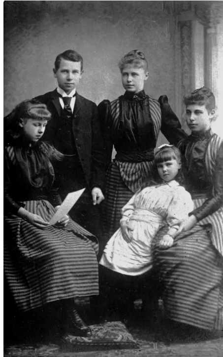
Familia Ducelui de Edinburgh