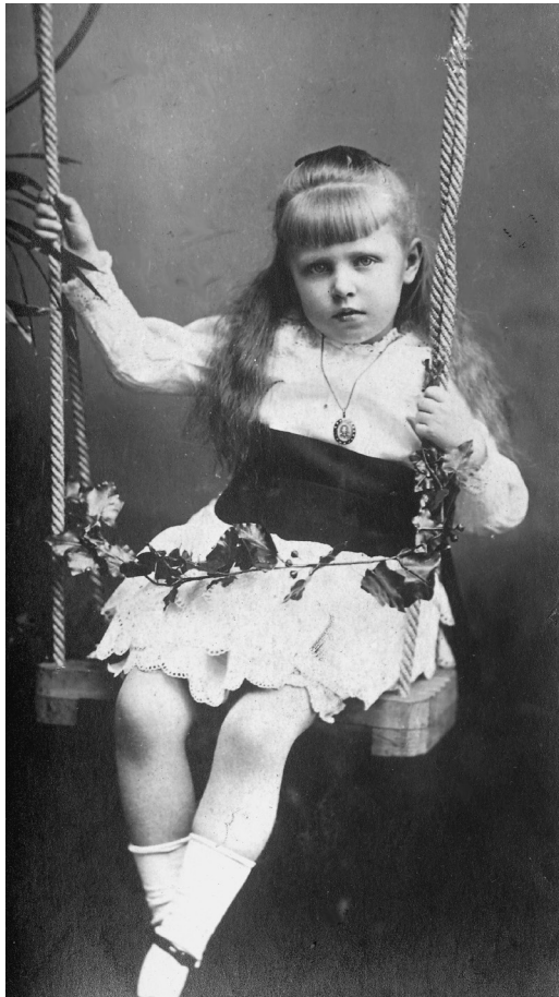
Principesa Maria la 5 ani