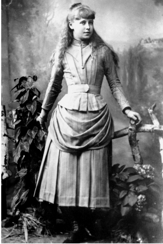
Principesa Maria la 14 ani